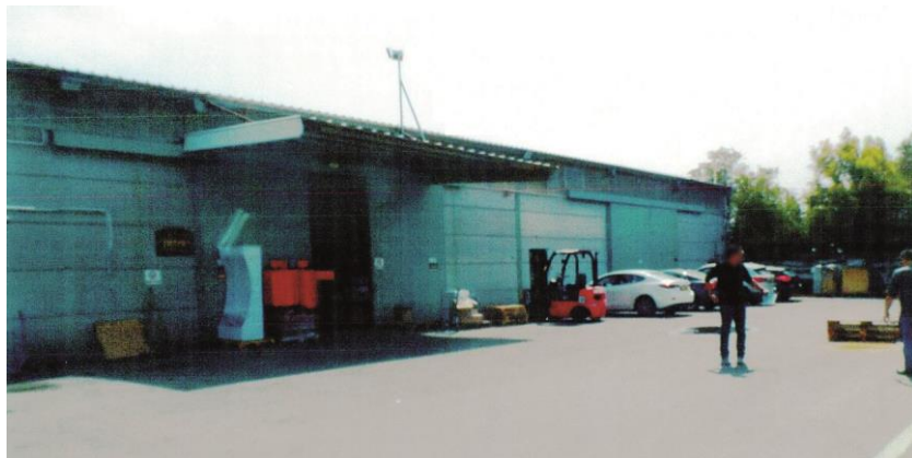
המקור: תיק הפיקוח בוועדה.

תמונה 2: מבנה בתחום הנחלה, כ-520 מ"ר שטח, ללא היתר בנייה ובסטייה מתוכנית