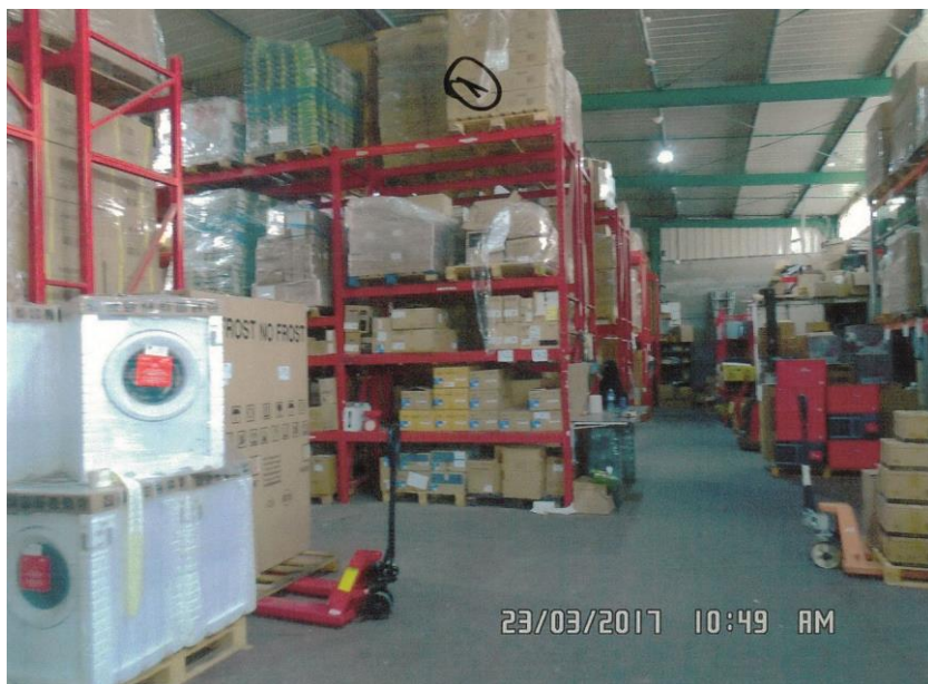
המקור: תיק הפיקוח בוועדה.