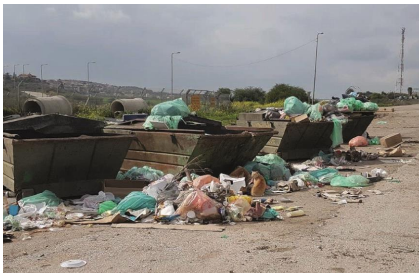
צולם על ידי צוות הביקורת בפברואר 2018.

ביוני 2018 מסר מנכ"ל המועצה האזורית שומרון לצוות הביקורת כי "אכן האשפה מפונה על ידינו באמצעות קבלן משנה. היו מספר בעיות נקודתיות... המכולות במקום טופלו ותוקנו. הודגש לאנשי הצבא במקום, שבמידה והפחים אינם מתפנים כראוי יפנו למועצה, בכל פעם שהתקבלה פניה כזו העניין טופל בטווח של 24 שעות".