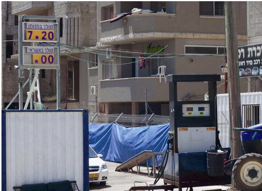
תחנת דלק בחצר בית