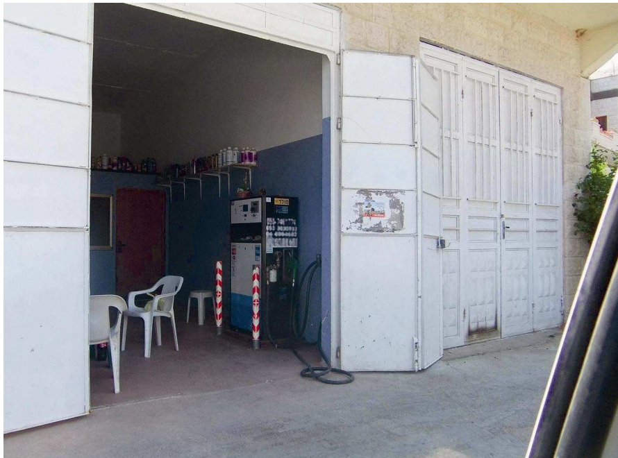
תחנת דלק בתוך בית עסק