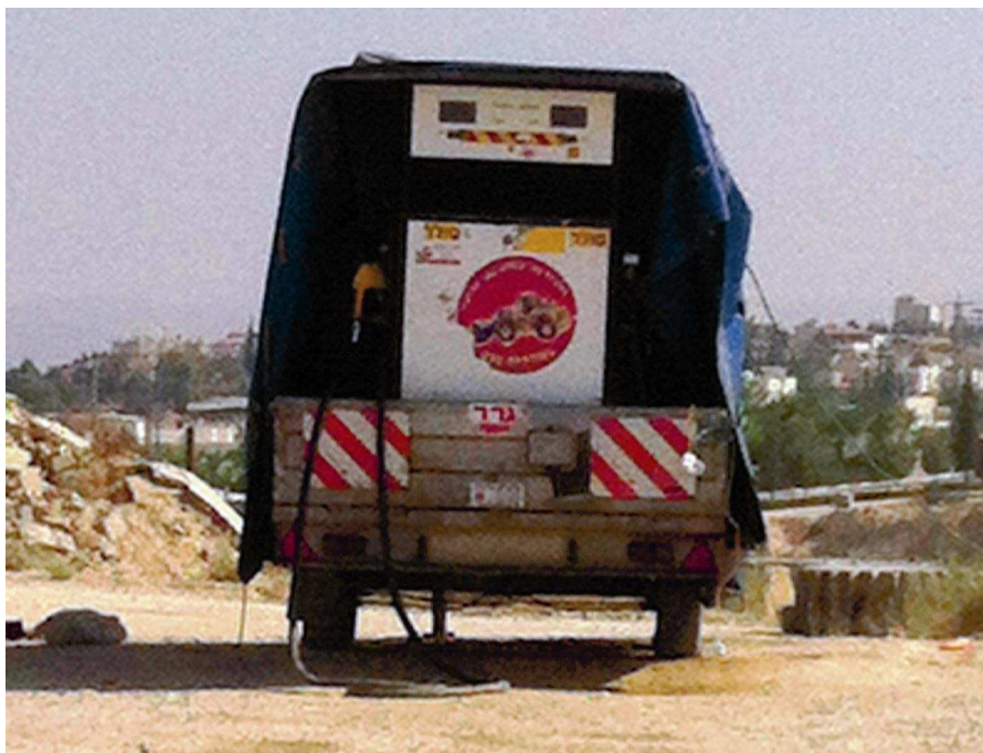
תחנת דלק נגררת