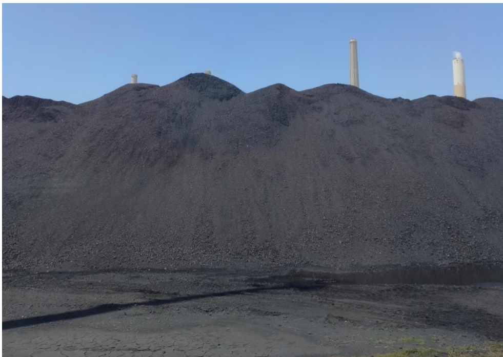
צולם על ידי צוות הביקורת, מאי 2023.