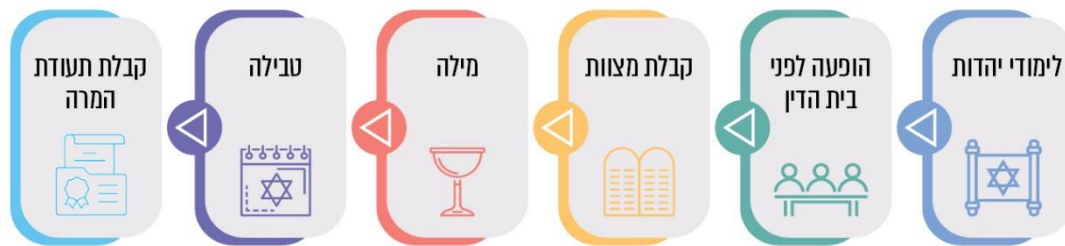
תרשים 1: שלבי תהליך הגיור

על פי אתר המרשתת של מערכת הגיור, בעיבוד משרד מבקר המדינה.