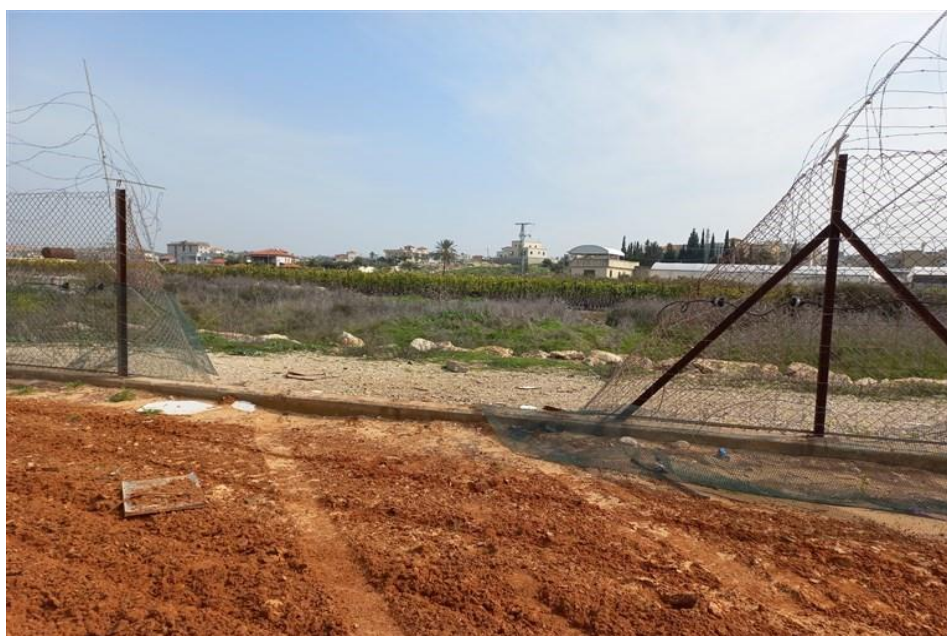
צולם על ידי צוות הביקורת בסמוך ליישוב במרכז הארץ בפברואר 2022.