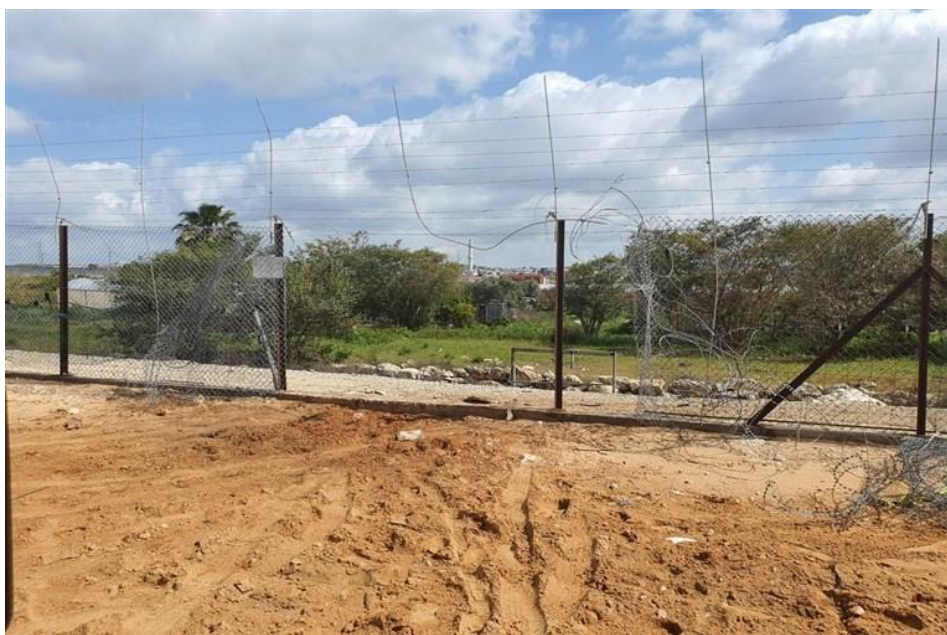
במרץ 2021 (טרום תחילת הביקורת).