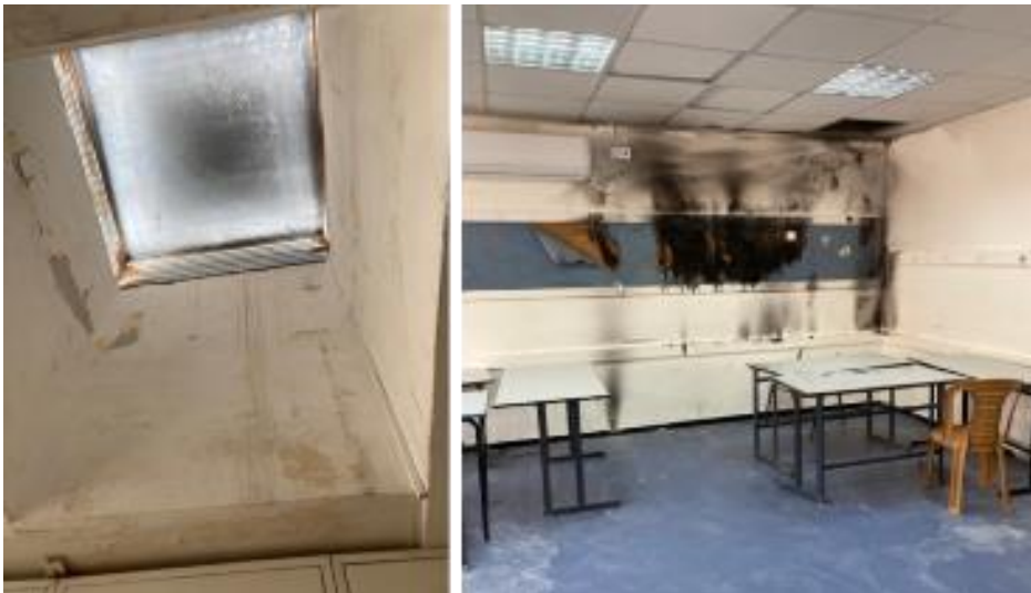
התמונות צולמו על ידי צוות הביקורת ב-14.6.22 וב-16.8.22.

מימין סימני שריפה בכיתה בבית ספר ו' במעלה עירון, ומשמאל ליקויי רטיבות בבית ספר י"ד בנתניה