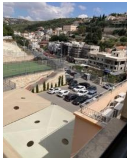
התמונה צולמה על ידי צוות הביקורת ב-14.6.22.