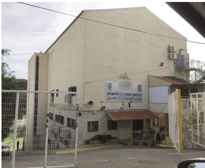
צולם על ידי מפקח בנייה של הוועדה המקומית לתכנון ולבנייה ב-4.12.17.