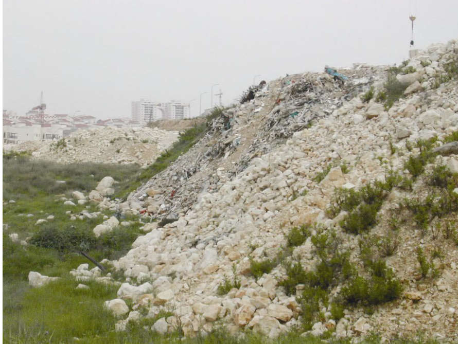
תמונה מס' 3 - מצבורים של פסולת בניין ועודפי עפר סמוך לרחוב עמק זבולון.

מתשובת המשרד לאיכות הסביבה למשרד מבקר המדינה מיולי 2005 עולה כי השר לאיכות הסביבה, מר שלום שמחון, נפגש עם שר הבינוי והשיכון, מר יצחק הרצוג, וסוכם כי משרד השיכון יממן מתקציבו פינוי פסולת בערים אשר בנה - לרבות מודיעין - עוד בשנת 2005.