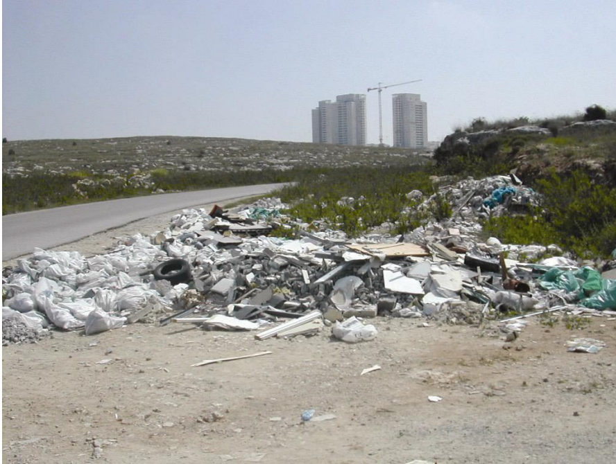
תמונה מס' 2 - פסולת בניין משיפוצים בהמשך רחוב עמק בית שאן, לכוון "אזור התעסוקה".

בסיוור שערכו עובדי משרד מבקר המדינה עם נציגי העירייה במרס 2005 נמצאו גם מוקדים רבים של פסולת בניין משיפוצים בצדי כבישים ובשטחים פתוחים נוספים ברחבי העיר, לדוגמה, ברחוב עמק זבולון וברחוב עמק בית שאן.